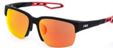
U28R: LENTI SPECCHiate ARANCIONI, MULTILAYER, ANTIGRAFFIO, IDROREPELLENTI. Sport d'acqua