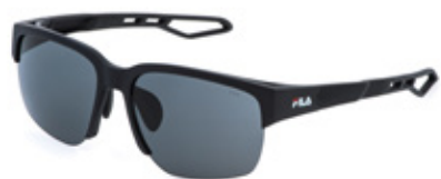
0U28: LENTI FUMO, ANTIGRAFFIO, IDROREPELLENTI. Tutti gli sport