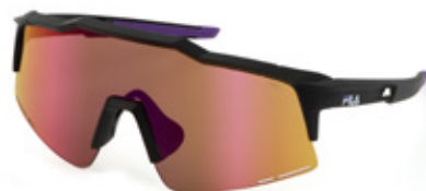
U28V: LENTE SPECCHIATA MARRONE, ANTIGRAFFIO, IDROREPELLENTE. Sport su strada