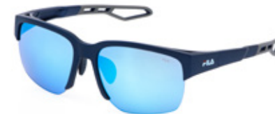
7U4B: LENTI SPECCHiate CELESTI, MULTILAYER, ANTIGRAFFIO, IDROREPELLENTI. Sport su green