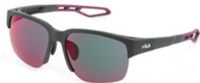
J97V: LENTI SPECCHiate VERDI, MULTILAYER, ANTIGRAFFIO, IDROREPELLENTI. Tutti gli sport