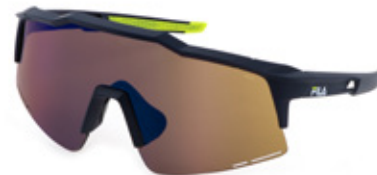
U43B: LENTE SPECCHIATA BLU, ANTIGRAFFIO, IDROREPELLENTE. Sport d'acqua