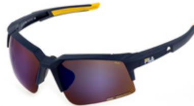
U43B: LENTI SPECCHIATE BLU, ANTIGRAFFIO, IDROREPELLENTI. Sport d'acqua