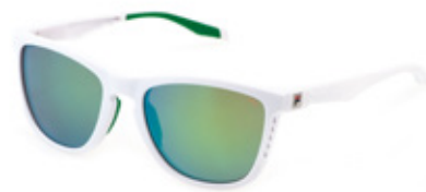
847V: LENTI SPECCHiate KHAKI, MULTILAYER, ANTIGRAFFIO, IDROREPELLENTI. Sport d'acqua