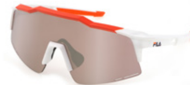
6VCX: LENTE SPECCHIATA SILVER, ANTIGRAFFIO, IDROREPELLENTE. Sport sulla neve