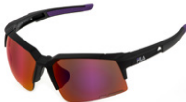
U28V: LENTI SPECCHIATE VIOLA, MULTILAYER, ANTIGRAFFIO, IDROREPELLENTI. Sport su strada