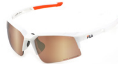
5WWX: LENTI SPECCHIATE SILVER, ANTIGRAFFIO, IDROREPELLENTI. Sport sulla neve