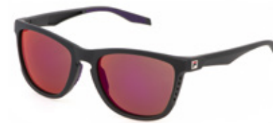
AAUX: LENTI SPECCHiate ROSSE, MULTILAYER, ANTIGRAFFIO, IDROREPELLENTI. Sport su strada