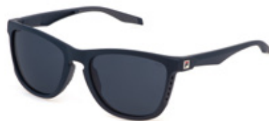
06QS: LENTI BLU, ANTIGRAFFIO, IDROREPELLENTI. Tutti gli sport