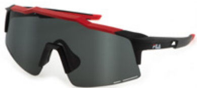
0965: LENTE FUMO, ANTIGRAFFIO, IDROREPELLENTE. Tutti gli sport