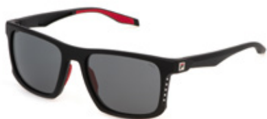
0U28: LENTI FUMO, ANTIGRAFFIO, IDROREPELLENTI. Tutti gli sport