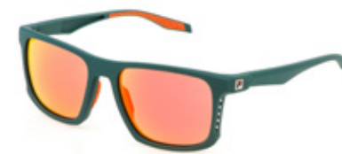
B63X: LENTI SPECCHIATE ARANCIONI, MULTILAYER, ANTIGRAFFIO, IDROREPELLENTI. Sport su green