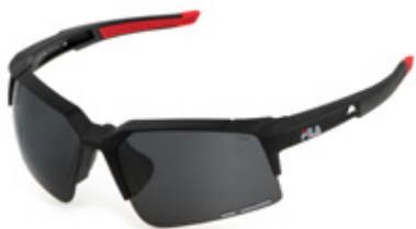
U28G: LENTI FUMO, POLARIZZATE, ANTIGRAFFIO, IDROREPELLENTI. Tutti gli sport